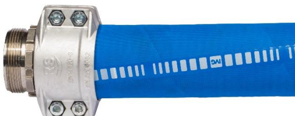
Obejma skorupowa śrubowa RS lub S.C.