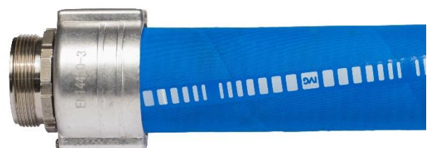
Obejma skorupowa sworzniowa PINCLAMP